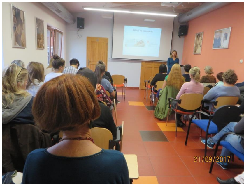
Přednáška o psychosomatice

Vzdělávací institut sv. Jana N. Neumanna, o.p.s. je také, ve spolupráci s Hospicem sv. Jana N. Neumanna a Domovem Matky Vojtěchy, organizátorem benefičních, kulturních a sportovních akcí, jejichž snahou je prosadit myšlenky hospicové péče do společnosti.