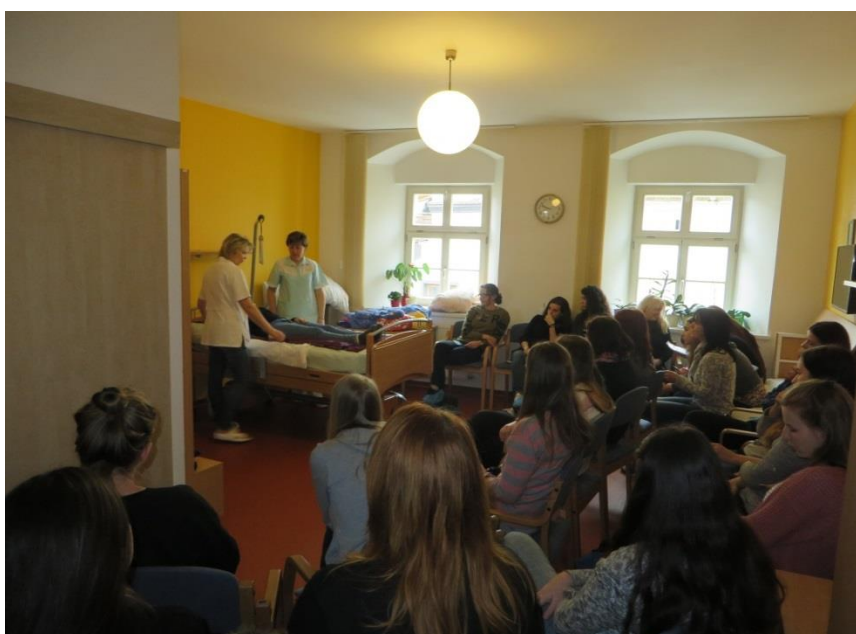
Praktická část kurzu pro studenty středních škol

Obecně prospěšná společnost založená Hospicem sv. Jana N. Neumanna, o.p.s. e věnuje vzdělávání odborné, ale i laické veřejnosti. Naší snahou je předávat široké spektrum informací a zkušeností v otázkách přímé zdravotnické a zdravotně sociální péče o těžce nemocné a umírající pacienty. Nabízíme též ucelený pohled na problematiku demencí a přístupy k lidem s Alzheimerovou chorobou. V průběhu roku jsou zájemcům kromě odborných seminářů a kurzů nabízeny také exkurze a stáže v Hospici sv. Jana N. Neumanna a v Domově Matky Vojtěchy. Aktuálním otázkám v oblasti hospicové péče se rovněž každoročně věnuje odborná konference, kterou pořádáme ve spolupráci s Hospicem sv. Jana N. Neumanna, o.p.s.